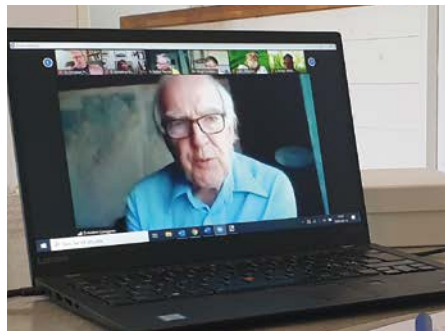
Fullmäktige på skärm.

liga ombud med tre uppmaningar till de nordiska regeringarna och parlamenten tillsammans med tre viktiga åtaganden som föreningen kommer att bidra med. Läs hela uttalandet "När det behövs som mest lyser nordiskt samarbete med sin frånvaro" här intill.